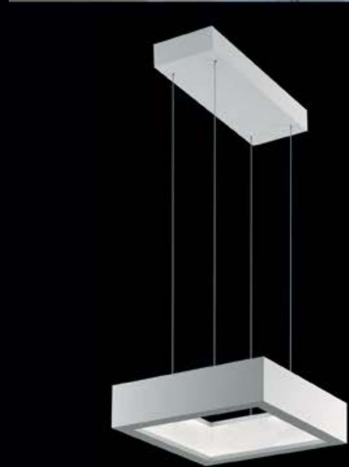
REVEALED • pendente • A130801 Cristais Swarovski e estrutura em alumínio pintado. • Cor: branco Medidas: 39 X 39 x H: 11cm - H total: 200cm Lâmpadas: LED 300K • Consumo: 46,8W Marca: Swarovski • Designer: André Kikoski • Áustria / USA