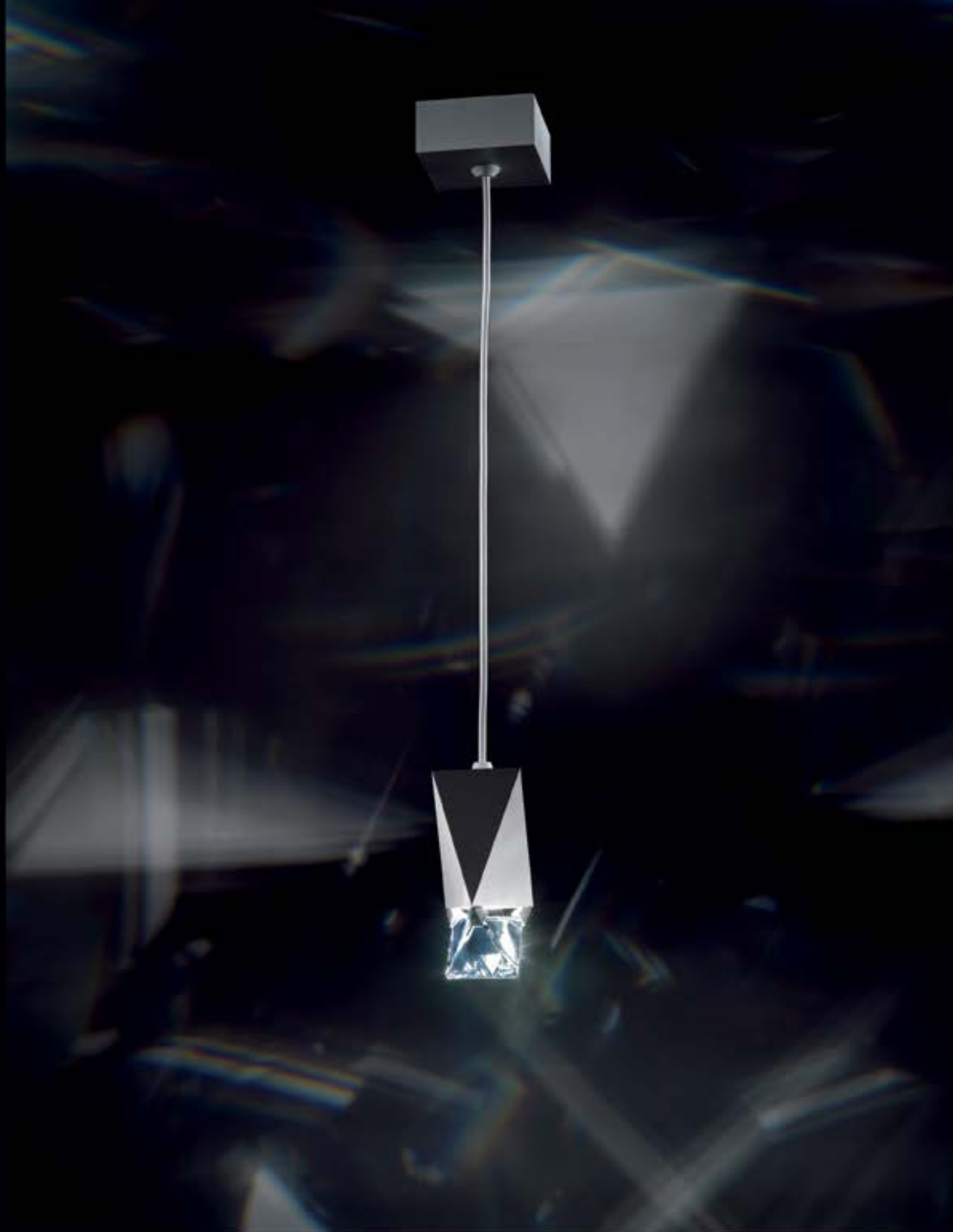
OCTA • pendente • A131501 Cristal Swarovski e estrutura em alumínio pintado. • Cor: branco Medidas: 7,3 x 7,3 x H:16,4cm - H total: 150cm Lâmpadas: 1x35W/12V Bipino IRC GU4) • Consumo: 35W Marca: Swarovski • Designer: Swarovski • Áustria / USA